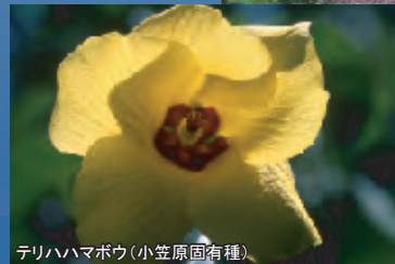
テリハハマボウ(小笠原固有種)