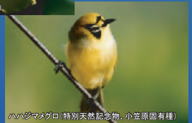
ハハジマメグロ(特別天然記念物、小笠原固有種)