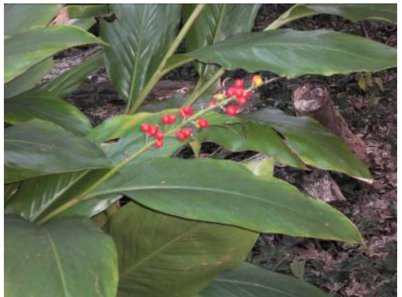
アオノクマタケラン